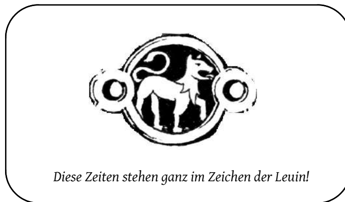
Diese Zeiten stehen ganz im Zeichen der Leuin!

Als die Kaiserin schließlich zum Heerzug gen Mendena rief, war auch die Kompagnie Herzogin Efferdane mit von der Partie, doch schien hier das Schicksal des jungen Barons und Hauptmanns der Kompagnie aufzugehen, denn als eine der ersten Baronien galt es, Baruns Pappel zu befreien. Während das Weidener und tobrische Heer sich einen blutigen Weg nach Mendena bahn-