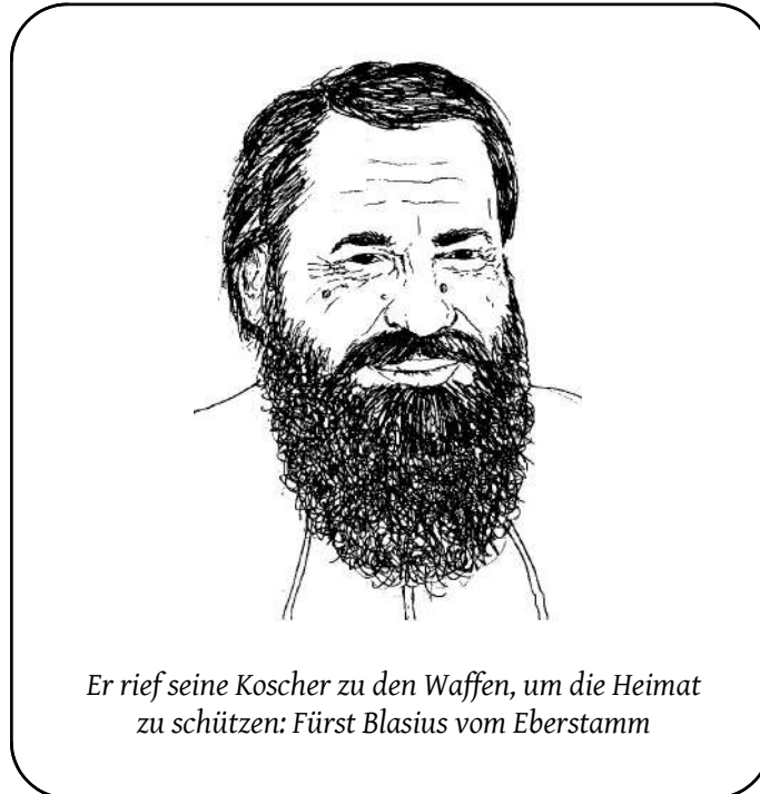
Er rief seine Koscher zu den Waffen, um die Heimat zu schützen: Fürst Blasius vom Eberstamm

„Als der Ruf zu den Waffen kam, hatten die Namenlose Tage gerade angefangen. Eine unheilige Hitze lastete auf dem Land, doch waren wir vorbereitet: Für solch einen Fall gab es die Aufmarschpläne ja schließlich, und so rief ich meine Landwehrleute zusammen und